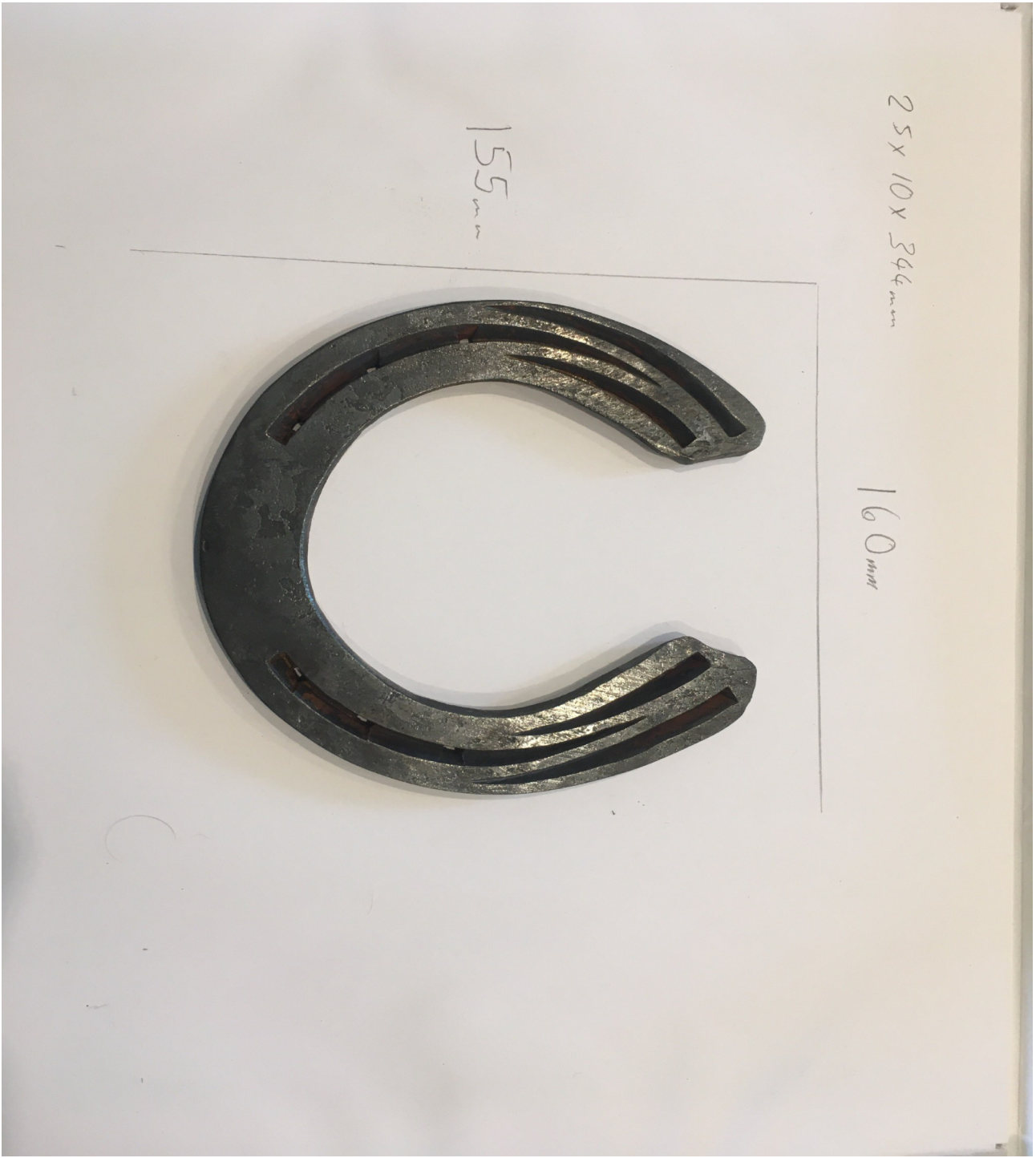
Material: 25 x 10 x 344